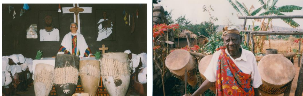
Bulungwa (1995) mtemi Daudi